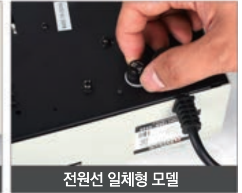
전원선 일체형 모델