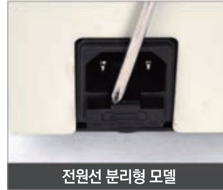
전원선 분리형 모델